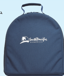
キャリングバッグ